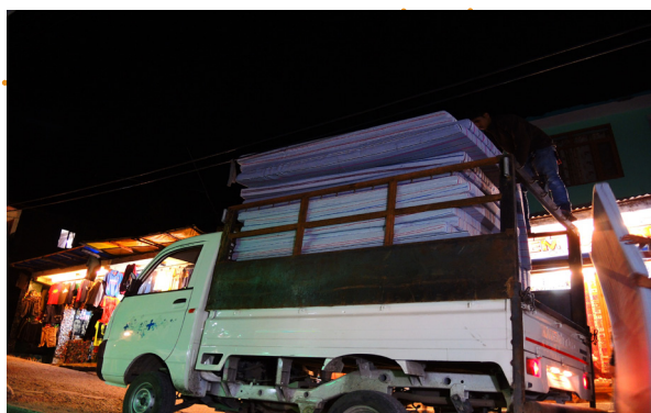
The 80 mattresses

This hostel was grounded by Buddhist monks and is situated in Leh. It accommodates 80 children originating from the poorest regions in southern Zanskar. Their sleeping mattresses were completely worn out. The board decided to buy 80 new mattresses in Manali and have those transported to Leh. Please find undermentioned their grateful response letter.