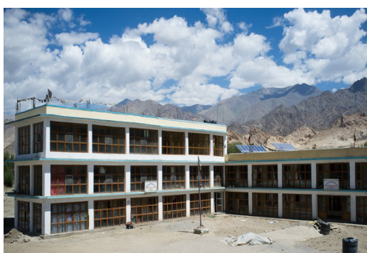
Lingshed hostel the bedrooms